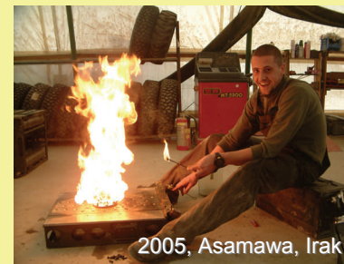
2005, Asamawa, Irak

Secretaris VVRTT Brinksestraat 13 6842 AN Elden Telefoon 026-3811606