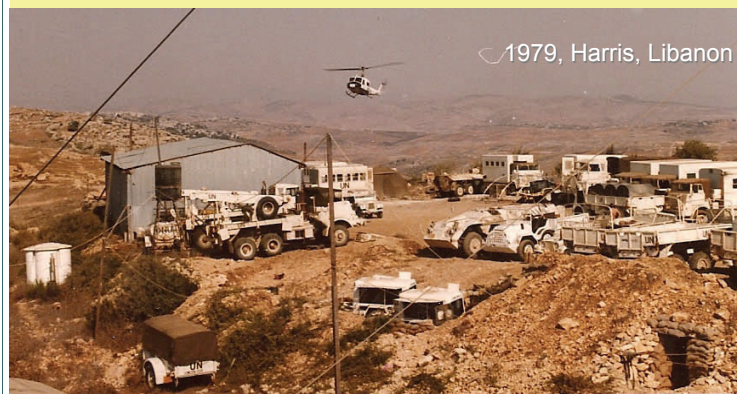
1979, Harris, Libanon