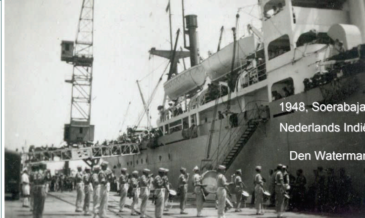
1948, Soerabaja, Nederlands Indië